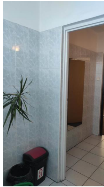
Rysunek 5 221a - łazienka II piętro II US w Toruniu