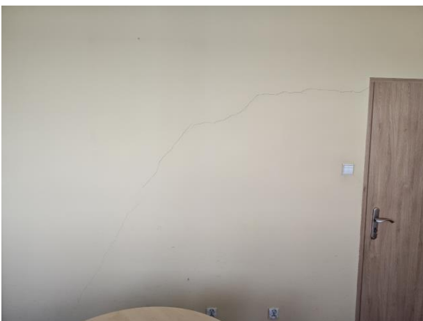
Rysunek 8 pokój 221d rysa na ścianie