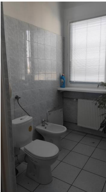
Rysunek 6 221a - łazienka II piętro II US w Toruniu