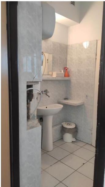
Rysunek 2 221a - łazienka II piętro II US w Toruniu