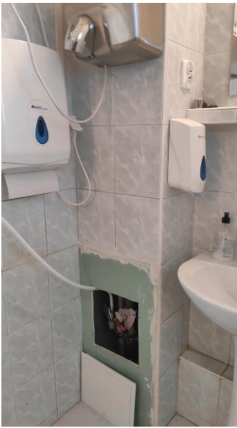
Rysunek 4 221a - łazienka II piętro II US w Toruniu