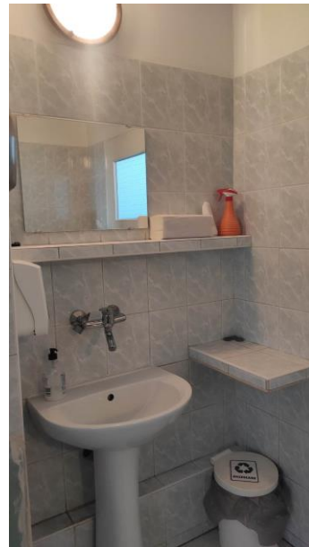
Rysunek 3 221a - łazienka II piętro II US w Toruniu