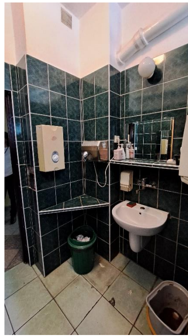
Rysunek 5 320 - łazienka III piętro II US w Toruniu