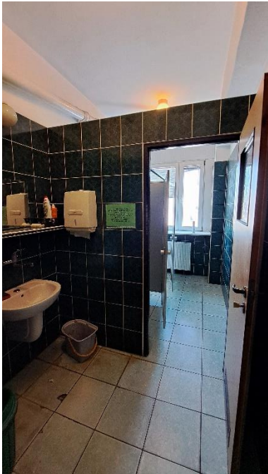
Rysunek 6 320 - łazienka III piętro II US w Toruniu

3.1.2. Zakres prac remontowych obejmuje w szczególności: