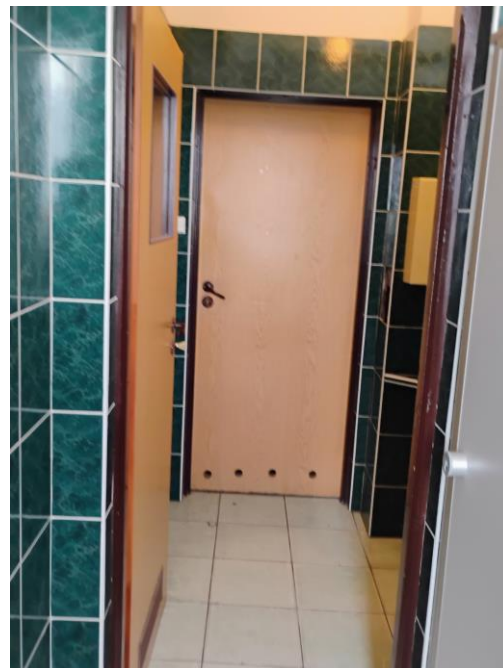
Rysunek 3 320 - łazienka III piętro II US w Toruniu