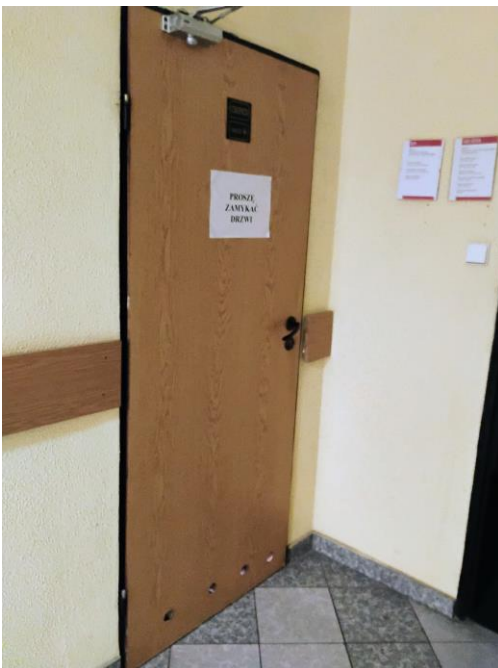
Rysunek 2 320 - łazienka III piętro II US w Toruniu