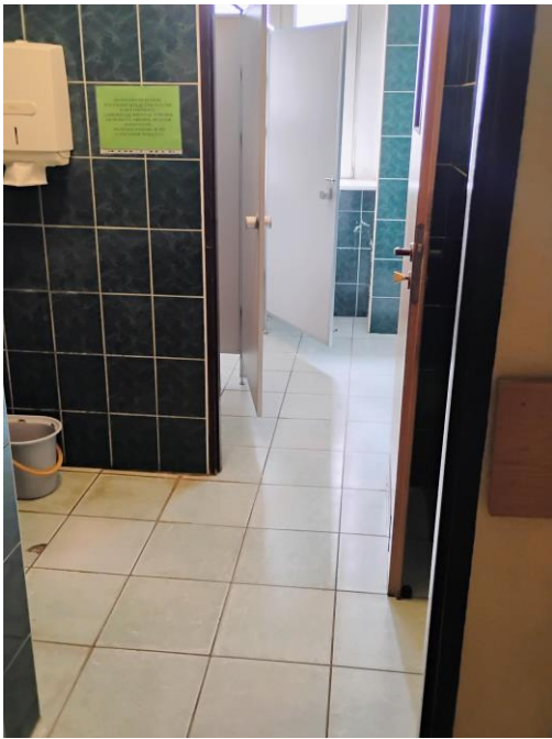
Rysunek 4 320 - łazienka III piętro II US w Toruniu